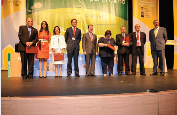
Representantes de los Ayuntamientos galardonados con el II Premio a las Buenas Prácticas Locales por el Clima junto al Presidente y Vicepresidentes de la Red Española de Ciudades por el Clima

de valoración que nos ayuden a promocionar medidas de actuación contra sus efectos y divulgar las experiencias innovadoras realizadas por las Entidades Locales.